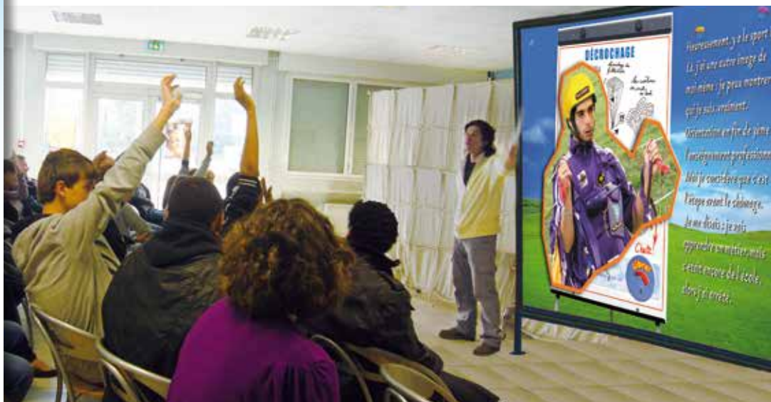
Une animation qui peut faciliter la coexistence de jeunes qui semblent ne rien avoir en commun.

L’animation propose aux participants (élèves, parents, équipes enseignantes, sanitaires et sociales) d’imaginer ce qui se passe dans la tête de ces jeunes et de rechercher ce qui pourrait les aider dans leur création d’un projet de vie. Elle aide à comprendre ce qui peut conduire au décrochage (celui des décrocheurs “physiques” et celui - plus fréquent - des “décrocheurs dans leur tête”, toujours présents en classe).